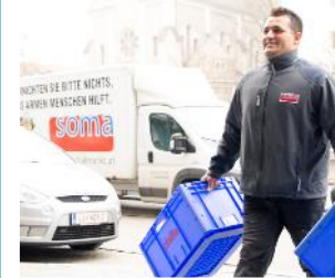
Sozial benachteiligte Menschen