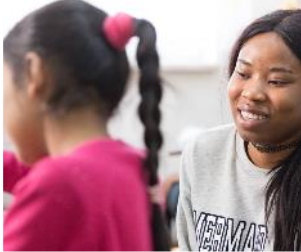
Kinder & Jugendliche