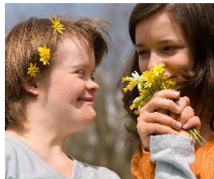
Menschen mit Beeinträchtigungen