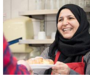
Asyl & Migration