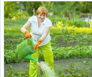
Umweltschutz & Klima